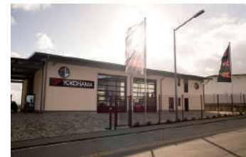
2006 年に設置したヨコハマ・テストセンター・ニュルブルクリンク