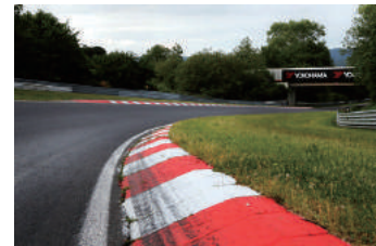
ニュルブルクリンクはアップダウンの激しい高速サーキット（写真上下）