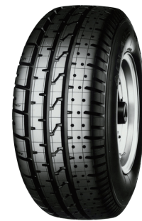
日本で 1981 年に発売した ADVAN-HF Type D。欧州で 1983 年から YOKOHAMA A008 の商品名で発売

1980 年代はじめ、横浜ゴムは欧州でのタイヤ販売強化に乗り出した。しかし欧州はミシュラン、コンチネンタル、ピレリなど世界的タイヤメーカーが競争する厳しい市場。ヨコハマタイヤは全くの無名であり、その中で知名度向上を図るには明確な個性が必要とされた。当時日本では「究極の走り」をアピールした乗用車用タイヤ ADVAN が好評だった。そこで欧州でも ADVAN に代表される HPT（ハイパフォーマンスタイヤ）に焦点を当てた個性作りを目指すことにした。その一環として 1982 年から欧州 F3 選手権、1984 年にはル・マン 24 時間レースにもタイヤを提供し、モータースポーツ活動を活発化した。同時に「HPT のヨコハマ」を体感できる商品として、1983 年からスイスで YOKOHAMA A008 の試行販売を開始した。同商品は日本で 1981 年に ADVAN-HF Type D の名称で発売したタイヤで、当時では珍しい非対称パターンとグリップ力を高めたコンパウンドを採用し、高速走行時の操縦安定性、ドライ・ウェットグリップ性能を徹底して追求した商品だった。当時、商標の関係から欧州では YOKOHAMA A008 の名称での発売となった。