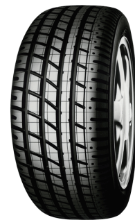
ポルシェの技術承認を取得した YOKOHAMA A008P