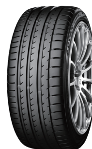
ADVAN Sport V105

新車用、市販用を問わずADVANを横浜ゴムのグローバル・フラッグシップ・ブランドにすることを訴求した広告(2005年)