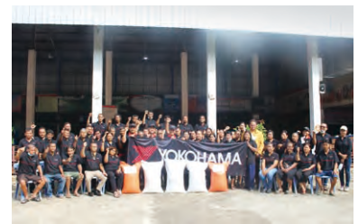
イベントに参加した天然ゴム農家の方々

タイで天然ゴム加工を行っているYTRCでは、スモールホルダーを継続的に支援するため、タイの農業・協同組合省管轄下にあるタイ天然ゴム公社(RAOT)と共同で、天然ゴムの品質向上に向けたセミナーイベントを定期的実施しています。2022年12月のセミナーイベントでは、スラタニ地区の50戸の農家に参加いただき、RAOTの知見を活かした肥料を1農家あたり250kg無償提供しました。また、参加した天然ゴム農家には、天然ゴム物性や生産性についての追跡調査にも協力していただいています。