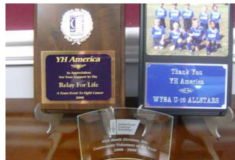
Relay for Lifeおよびスポンサーになったサッカーチームからの感謝盾