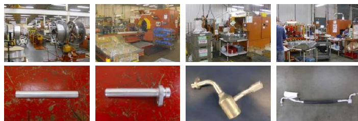
チューブ切断 端末加工 金具加工(ロー付け) アッセンブリー

創業以来の主要生産品である自動車用エアコンホースアッセンブリーは、日産車セントラやマキシムに使用されており、2012年からは、同社向けピックアップトラックへの採用が決定しています。その工程を紹介します。