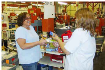
各自が持ち寄った菓子類の売上金を全額寄付 (販売風景)