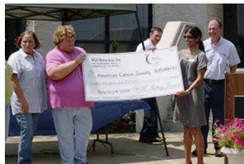
2万ドル小切手のがん基金への授与式 (2010年度の目標金額は、25千ドルです。)