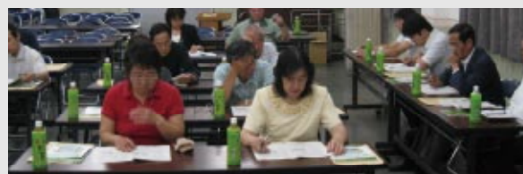
2008年6月に三重工場で開催した意見を聴く会