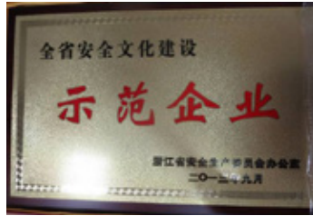
浙江省安全モデル企業

杭州市開発区では当社が安全モデル企業として安全の実績を評価されていますが、2012年初に政府要求を超える日本OSHMSにも認証され、2014年11月に再度審査に合格、中国国家2級安全基準の再審査にも合格しました。将来には中国国家1級安全基準に合格するよう努力していきます。